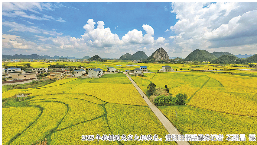
2025年拍摄的龙宝村坝秋色。

目前，龙宝村有16户村民的闲置房屋具备改造条件，5家家农场可提供农耕体验，避暑旅居产业基础扎实。