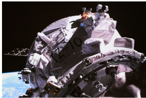
5月11日在北京航天飞行控制中心屏幕上拍摄的天舟十号货运飞船向空间站组合体靠拢的画面。 新华社发

5月11日8时14分,搭载天舟十号货运飞船的长征七号遥十一运载火箭,在我国文昌航天发射场点火发射,约10分钟后,天舟十号货运飞船与火箭成功分离并进入预定轨道,之后飞船太阳能帆板顺利展开,发射任务圆满成功。 新华社发