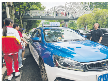
▲6月7日,准备乘坐“爱心送考”出租车的学生和家。