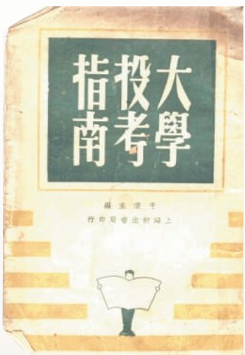
上海新生书局的《大学投考指南》

的公立、私立高等学校，并从经济负担的角度，分析各高校的收费情况。比如《投考专科以上学校指导》，统计了70所高校的学费、住宿费、杂费、实验费、图书费、讲义费、体育费等费用。每年除了饭费、服装费外，国立大学约需20至30元，私立大学多至80元。费用是影响考生选择的重要因素，考生们翻翻这些表格，能大体决定投考哪些学校。