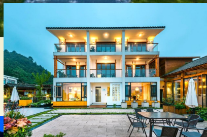
花筑·贵阳星宿民宿