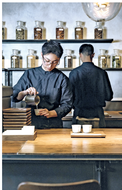
乔治队长咖啡“风味博物馆”咖啡师正在制作咖啡。 资料图片