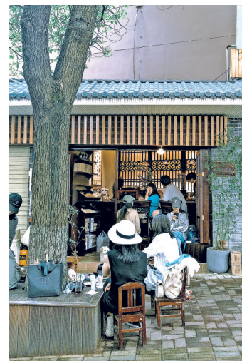
“朴羽珈琲”门店。 资料图片

从街头巷尾的烟火气，到冠军门店的匠心味，贵阳咖啡用两种看似不同却同样扎根市井的姿态，书写着专业不高冷、烟火有质感、日常亦高光的动人故事，一杯醇香正让这座城市被更多人看见、喜爱。贵阳市文旅局数据显示，贵阳市目前共有世界咖啡锦标赛冠军6人，其中世界冠军1人、中国区冠军5人，“咖啡冠军之城”成为贵阳新名片，“贵阳咖啡”在抖音、小红书等社交平台相关浏览量突破3亿次。