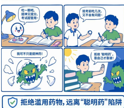
《那些披着羊皮的毒》系列漫画(三) 害人的聪明药