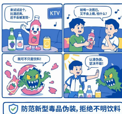
《那些披着羊皮的毒》系列漫画(二) 伤人的饮料