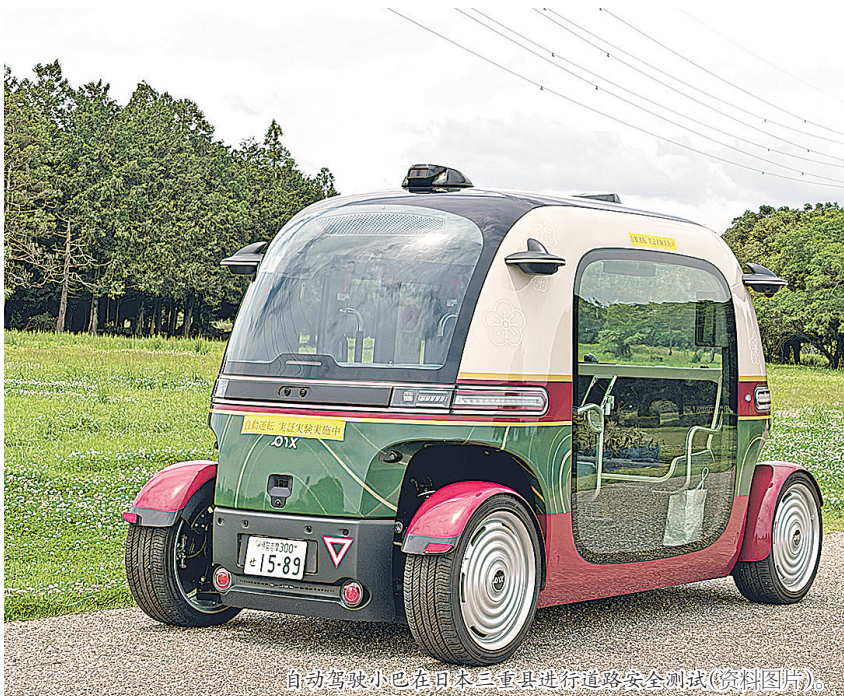
自动驾驶小巴在日本三重县进行道路安全测试(资料图片)。