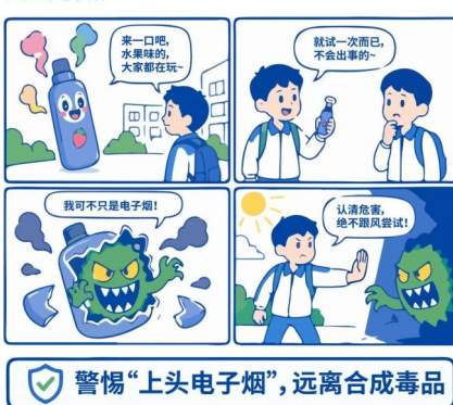
《那些披着羊皮的毒》系列漫画(四) 上头的电子烟