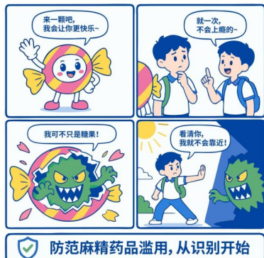
《那些披着羊皮的毒》系列漫画(一) 伪装的糖果