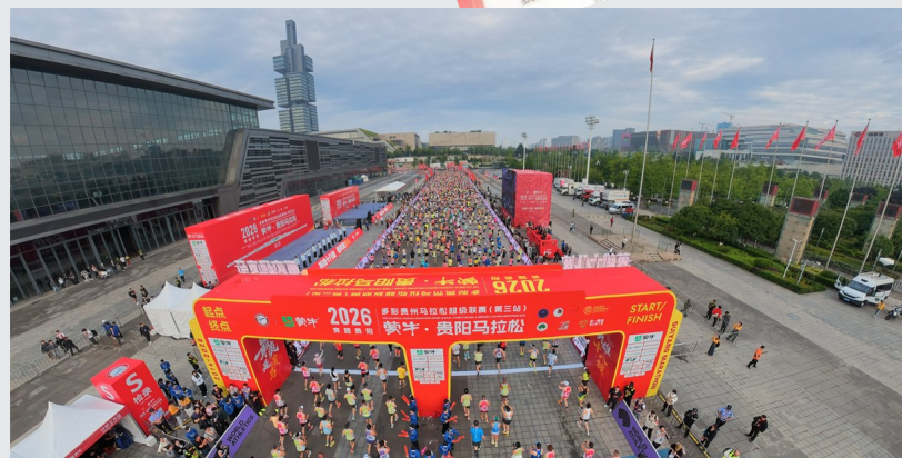
2026贵阳马拉松以赛为媒吸引大量外地跑友感受爽爽贵阳。

6月有贵马和世界拳联世界杯，7月有亚洲速度轮滑系列赛，8月有现代五项世锦赛，顶级赛事和演艺活动轮番登台，以高频优质场景持续引流，以票根政策持续留客。