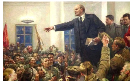
列宁把《国际歌》介绍到俄罗斯

1917年二月革命胜利，《真理报》发表《国际歌》。半年多后，十月革命爆发，高唱《国际歌》的布尔什维克取得胜利，《国际歌》见证了这个